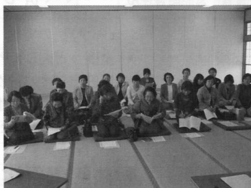
女性部総会議案審議