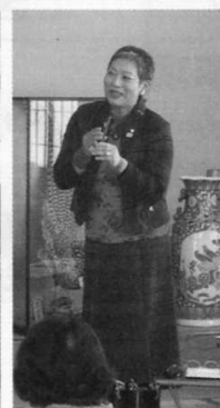
折原女性部長挨拶

なぎっていました。また、今年度の研修旅行については、酒田市方面で舞妓さんの踊りを見ながら食事の出来る料亭や案が出されました。その後部員による踊りや歌が披露され、賑やかな懇親会となりました。